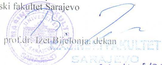
prof.dr. Izet Bijelonja, dekan