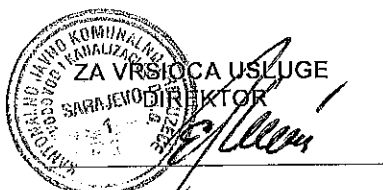
Enver Hadžiahmetović dipl.ing.maš.

Ovaj Ugovor sačinjen je u četiri /4/ primjeraka, od kojih Ugovorni organ zadržava tri / 3/ , a Vršilac usluge jedan /1/ primjerak .